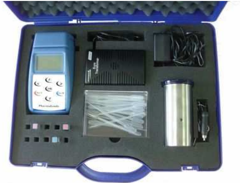
L'EzyBot® © Pharmaleads

Nous avons alors cherché à optimiser les substrats pour accroître la vitesse de réaction, la sensibilité, et la sélectivité. Il fallait également obtenir des cinétiques de détection d'une heure au maximum. Il a fallu ensuite formuler les réactifs pour un usage hors du laboratoire (durée de vie, stockage, reproductibilité des mesures,...), trouver le fluorimètre de terrain adapté, puis définir un mode « totalement » automatique d'utilisation.